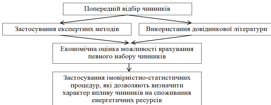
Рисунок 1— Схема реалізації комплексного підходу до визначення складу чинників при встановленні «стандартів» енергоспоживання

Розробка методології вибору чинників, які суттєво впливають на процес енергоспоживання є важливою задачею для побудови та коректного функціонування систем КіП. Авторами запропоновано комплексний підхід до визначення їх складу, структурна схема якого наведена на рис. 1.