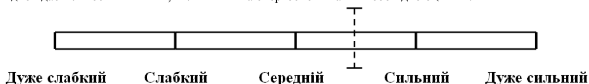
Рисунок 2 — Інтервальна шкала для експертного оцінювання впливу чинників на величину енергоспоживання

Особливістю даного методу є те, що визначення ступеню впливу чинників на енергоспоживання можна здійснювати, застосовуючи не кількісні, як в попередніх двох методах, а якісні оцінки, які подаються експертами у вигляді так званих лінгвістичних змінних. При використанні цього методу кожному з експертів пропонується, виходячи з його думки щодо) впливу чинників (на енергоспоживання, поставити відповідну позначку на інтервальної шкалі, що має вигляд лінійки з лінгвістичними оцінками ступеню цього впливу (рисунок 2). Кількість таких інтервальних шкал відповідає кількості чинників, вплив яких на енергоспоживання необхідно оцінити.