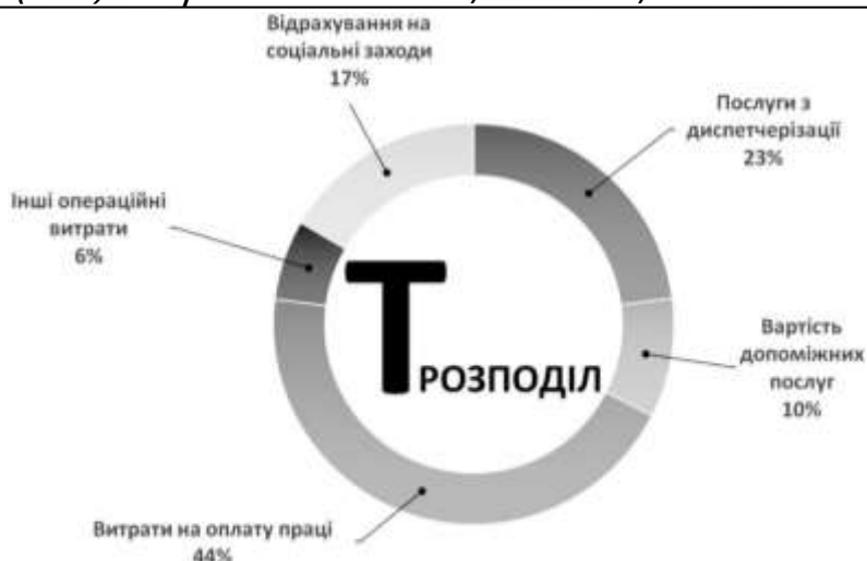
Рисунок 3 – Структура середньозваженого тарифу з розподілу електричної енергії.

Таким чином, в діючій моделі ринку всі ціни та тарифи ПРТ та споживачів, як на оптовому так і на роздробному ринку, встановлюються з боку держави. Тарифи на передачу, розподіл та постачання не включають в себе джерела на купівлю електричної енергії. Роздрібні тарифи у споживача є джерелом коштів для тарифів на розподіл та постачання, а також для купівлі електричної енергії в ОРЕ з урахуваннями втрат в мережах.