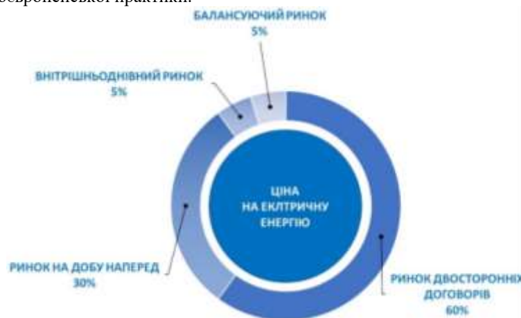
Рисунок 4 – Можливий сценарій перерозподілу обсягів електричної енергії між сегментами ринку електричної енергії, яку будуть купувати електропостачальники

Перш за все розглянемо ціноутворення на електричну енергію в новій моделі ринку. На ринку електричної енергії п’ять сегментів, на яких учасники ринку мають можливість купувати або продавати електричну енергію. На Рисунку 4. наведений можливий сценарій перерозподілу обсягів електричної енергії між сегментами ринку, яку будуть купувати електропостачальники. Цей сценарій побудований виходячи з загальноєвропейської практики.