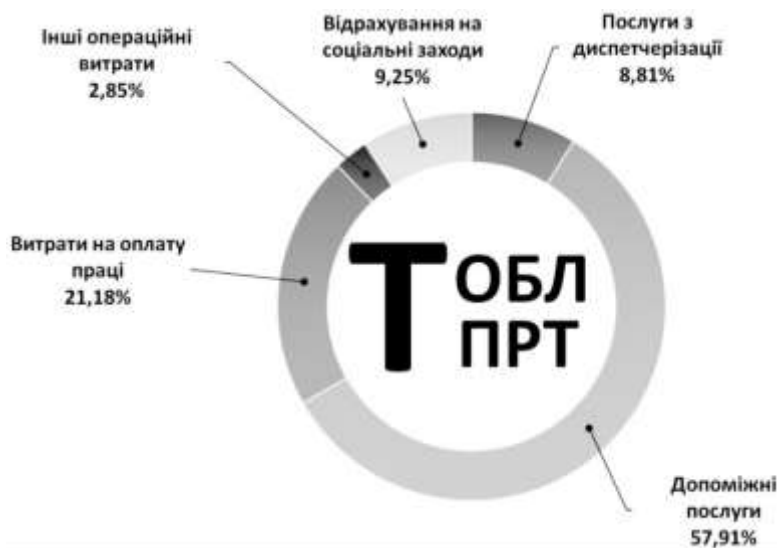
Рисунок 2 – Структура тарифу ПРТ з постачання електричної енергії споживачам України.

Як правило, діяльність ПРТ здійснює підприємство, яке також здійснює діяльність з розподілу електричної енергії - транспортування електричної енергії місцевими (локальними) електричними мережами. Тарифи на діяльність з розподілу електричної енергії також встановлюються Регулятором для кожного підприємства окремо. На Рисунку 3. наведена структура середньозваженого тарифу з розподілу електричної енергії. Найбільшу частку в структурі тарифу на розподіл займає фонд заробітної плати, а інші складові є джерелом покриття витрат на підтримання функціональності розподільчих мереж та їх розвитку. Слід зазначити, що в тарифі на розподіл включені додаткові кошти на фінансування інвестиційної програми розвитку розпо-дільчої мережі.