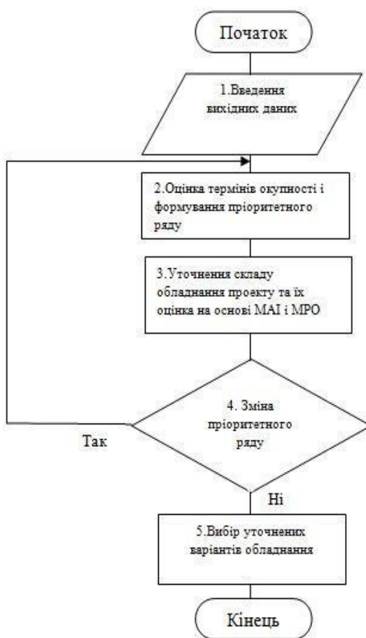
Рис.3. Алгоритм вибору складу обладнання та технологій проектів енергоспоживання на основі СППР