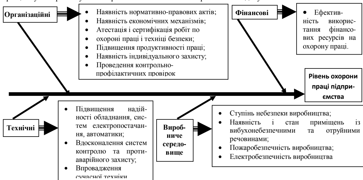
Рис.2 Сукупність показників, що впливають на рівень охорони праці виробничої системи

методом замірів, які відображають стан системи. Інформація накопичується та аналізується в динаміці, при цьому використовується порівняння з базовими та нормативними документами.