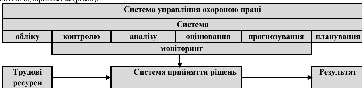
Рис. 3 Функціональна схема взаємодії усіх складових управління охороною праці

Визначимо використання поняття “моніторингу” у сфері управління охороною праці. Система управління охороною праці потребує чіткого взаємозв’язку між усіма складовими з метою адекватності прийняття управлінських рішень та підвищення ефективності управління безпекою та безаварійною роботою підприємства (рис.3).